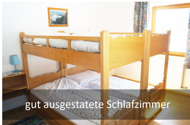
gut ausgestattete Schlafzimmer